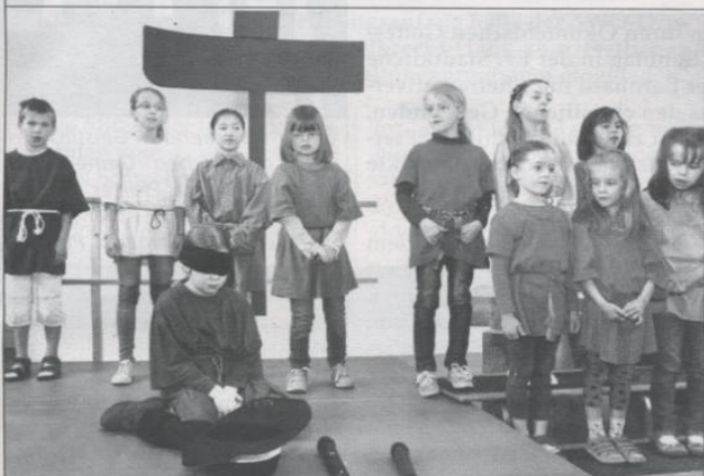
Bartimäus hofft auf Rettung