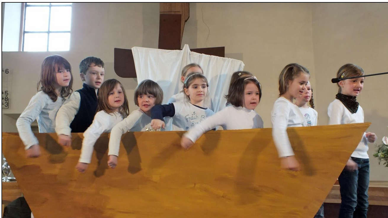
Jesus und die rudenden Jünger im Boot.