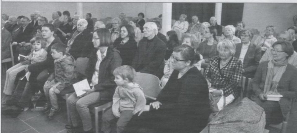
Gebannt verfolgte die Gemeinde das Spiel der Kinder

Kontakt: Eva Braunstein (braunstein.eva67@googlemail.com), Tel. 06201/508430.