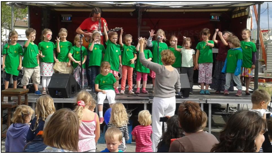
Sommerfest Lützelsachsen Ebene

Beim Erntedank-Gottesdienst wurde ein Lied vorgetragen, zum ersten Mal mit der rhythmischen Begleitung durch die neuen Orff'schen Instrumente. Beim Kaffeekränzchen am 1. Advent wurden zwei Lieder gesungen. Beim Engelchor zum Heiligen Abend wirkten viele zusätzliche Kinder mit, im ersten Gottesdienst waren es insgesamt 22 Kinder.