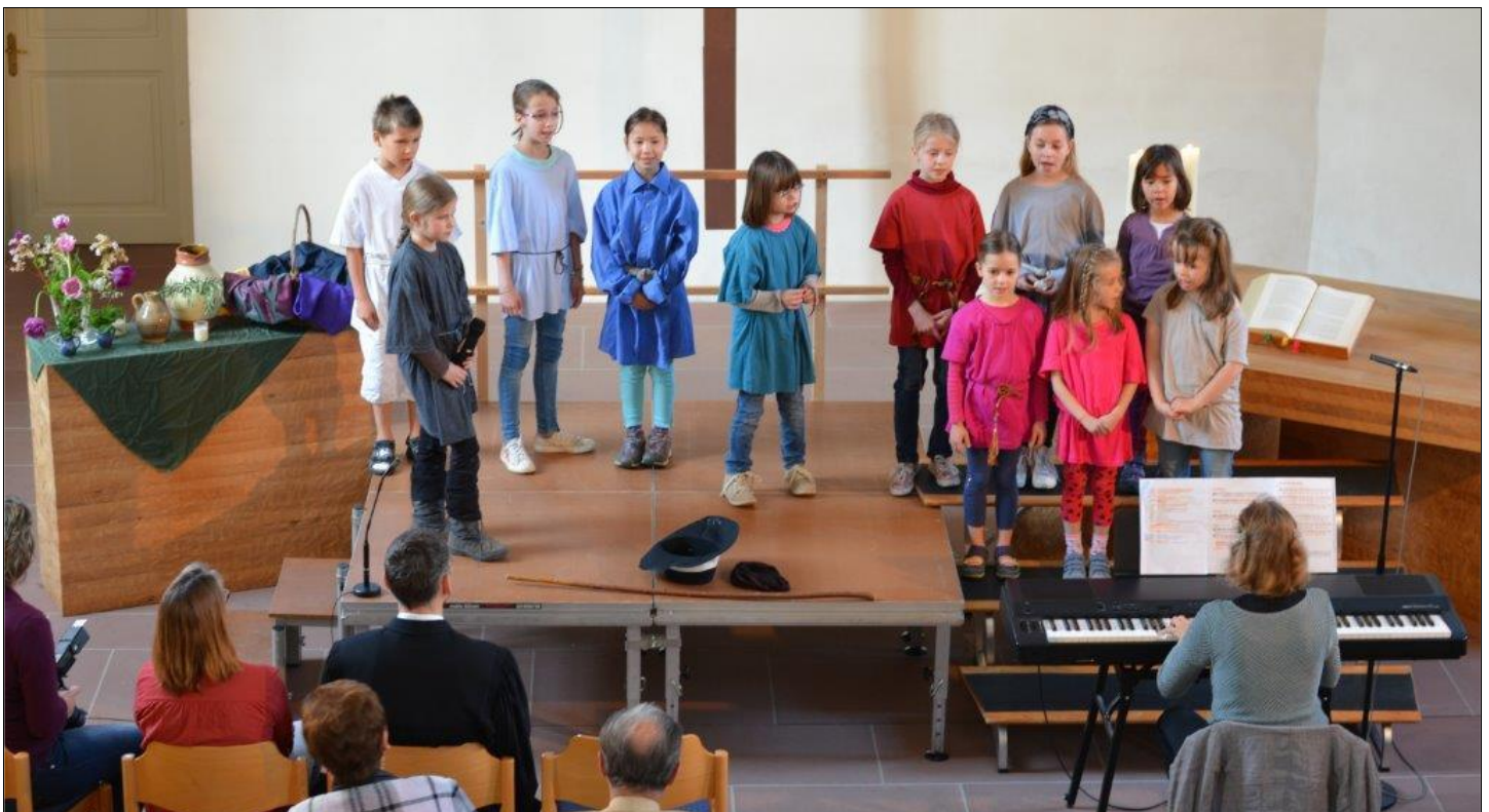
Stiftungsfest am 28. Juni 2014